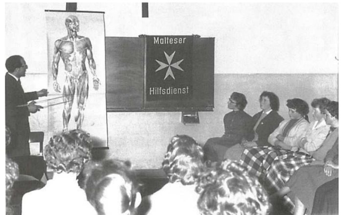
Damalige Ausbildung von Schwesternhelferinnen

Der deutsche Malteser Hilfsdienst e.V. wurde 1953 vom Malteserorden und Deutschen Caritasverband als Fachverband der Caritas gegründet. Zu den hoheitlichen Aufgaben im Katastrophenschutz und in der Breitenausbildung der Bevölkerung in Erster Hilfe kamen später die Malteser Jugend sowie soziale Dienste in der Auslands-, Alten-, Behinderten- und Flüchtlingshilfe hinzu. Hauptamtliche Dienste, der Rettungs- und Fahrdienst, Menüservice und Hausnotruf, wurden in den letzten Jahren in eine gemeinnützige GmbH überführt.